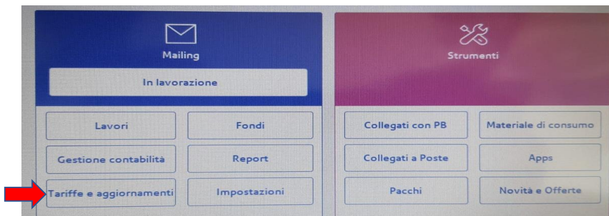
Figura 2 Nuova interfaccia