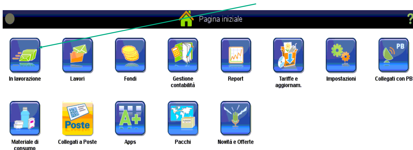
Figura 3 Vecchia interfaccia

Una volta riavviata la macchina, selezionare l'icona "In Lavorazione"