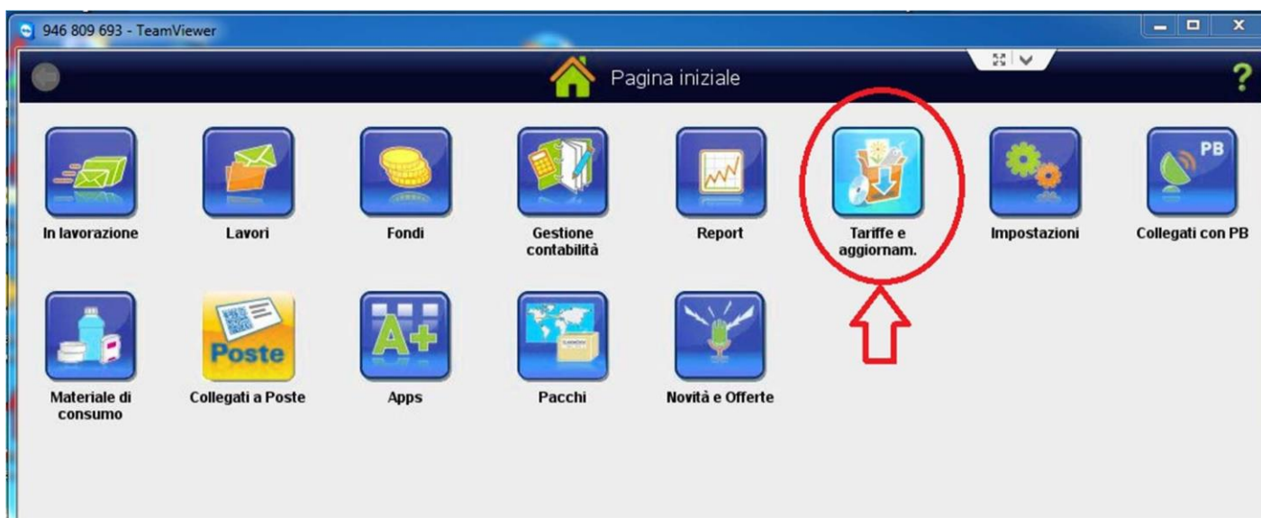
Figura 1 Vecchia Interfaccia